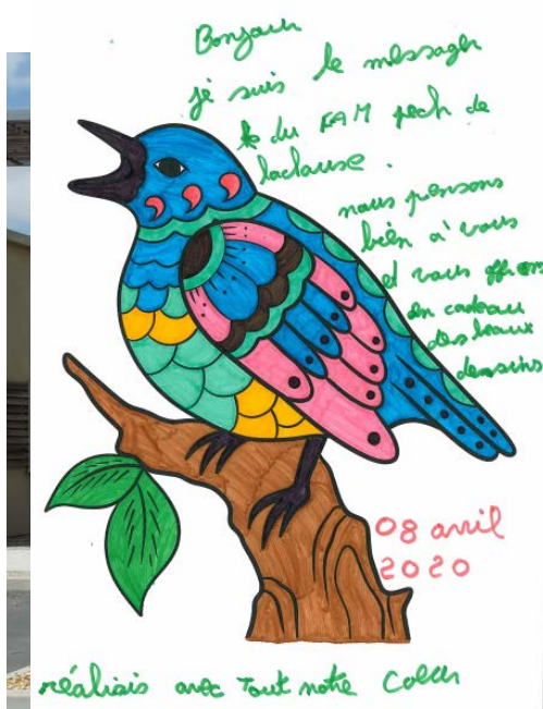
FAM Pech de Laclause

Je remercie chaleureusement toutes celles et tous ceux qui ont participé à cette belle opération ! »