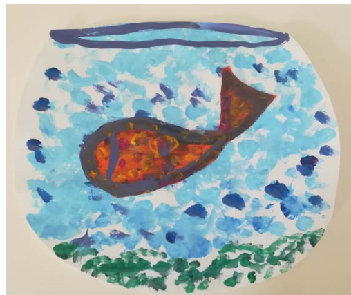
IME Les Hirondelles AFDAIM Carcassonne

L'outil mis en place par le service informatique du Département sera déployé pour remplacer skype.