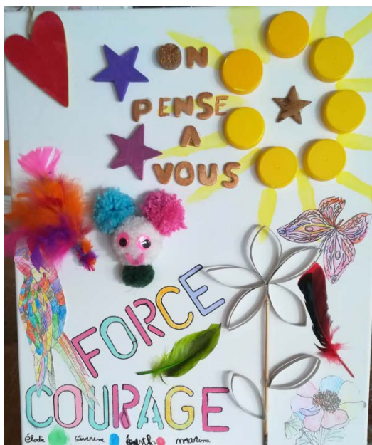
Foyer de vie Afdaim de Castelnaudary

-le lien avec le service prévention santé du Département notamment pour les personnels en parcours d'immersion.