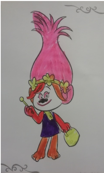
IME La Solo APAJH11

Pas de rendez-vous ni de consultation (sauf si indispensable et en accord avec la Direction) compensés par des entretiens téléphoniques systématiques