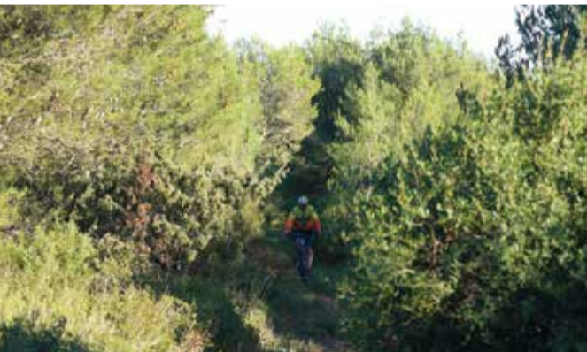
- Vue "du Léger" -

Vous quitterez le village de Fleury d'Aude en empruntant un chemin roulant. Vous prendrez une montée assez raide à droite pour accéder au plateau du lieu-dit "Bellevue". Vous roulez sur des pistes qui vous mèneront vers les hauteurs du massif de la Clape, qui vous feront découvrir des panoramas extraordinaires, sur le littoral héraultais et audois. Vous suivrez la direction du "Domaine de l'Oustalet", une descente rapide vous mènera dans la combe du "Léger", vous bifurquerez par les ruines d'une ancienne bergerie, du même nom. Puis vous suivrez à gauche un single jouant au milieu des pinèdes et des chênes verts. Vous prendrez à droite un single jouant dans la descente qui domine le domaine de "Laquirou" et son vignoble. Vous emprunterez un chemin roulant de la "Route des vins" bordé de domaines viticoles et de leurs vignobles. Puis vous monterez à gauche vers le point culminant du massif de la Clape. Ce parcours s'adresse aux vététistes expérimentés.