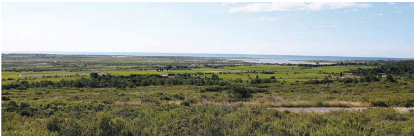
- Vue de "La Clape" -

Parc naturel régional de la Narbonnaise en Méditerranée , 04 68 42 23 70. www.parc-naturel-narbonnaise.fr www.facebook.com/PNR.Narbonnaise - twitter.com/PNR_NM