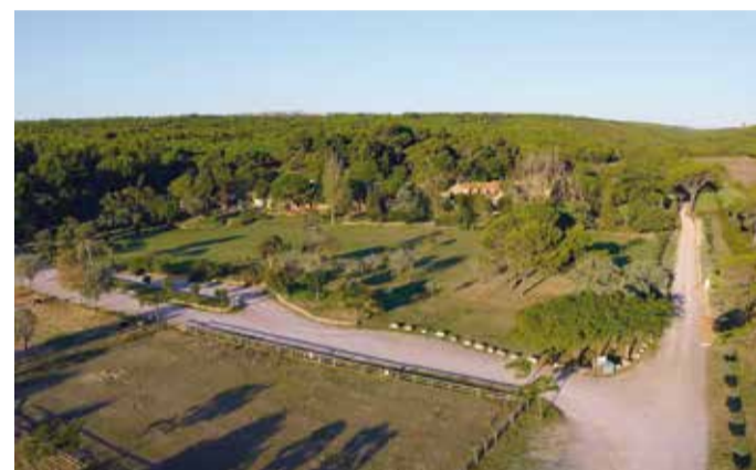
- Vue du "Domaine de l'Oustalet" -

Ce circuit familial vous fera aimer la pratique du VTT. Vous quitterez le domaine de "l'Oustalet" en passant à l'arrière du corps de ferme (poney club). Vous suivrez les pistes roulantes vers les hauteurs du massif de la Clape. Au poteau "Four de Rome", vous prendrez la direction du "Domaine de l'Oustalet", qui vous ramènera à votre point de départ en passant aux pieds de la villa gallo-romaine, dans un décor de garrigue méditerranéenne. A pratiquer en famille ou pour le plaisir de rouler.