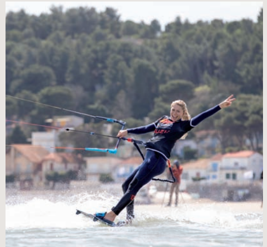
Le littoral du canton des Corbières maritimes fait la part belle aux activités de loisirs, avec un spot mondialement réputé pour les sports de glisse.