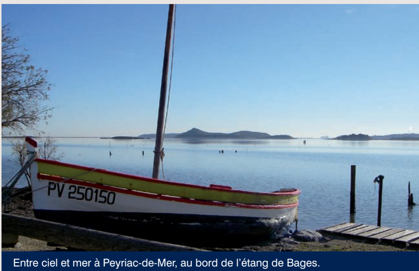
Entre ciel et mer à Peyriac-de-Mer, au bord de l'étang de Bages.