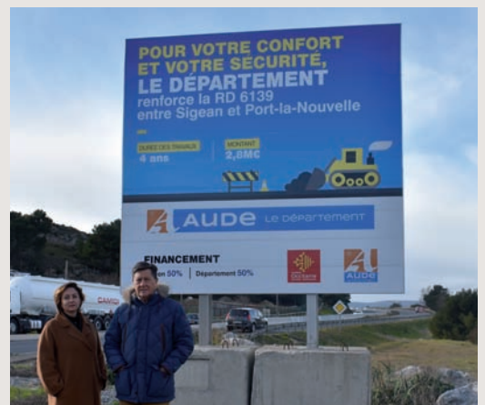
Le Département de l'Aude finance les travaux d'aménagement sur la RD6139 entre Sigean et Port-la-Nouvelle.