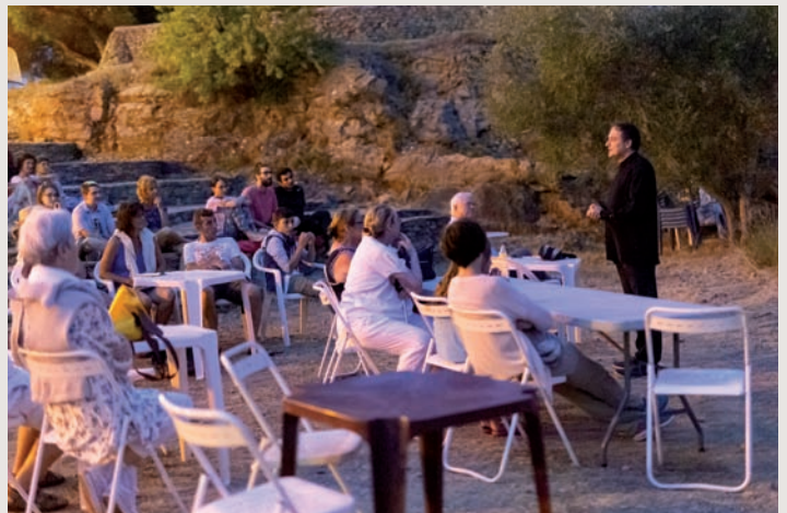
En juillet dernier, le Festival en garrigue a convié les spectateurs à des représentations théâtrales en plein air.