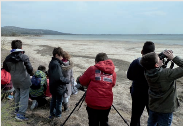
Le Parc naturel régional de la Narbonnaise en Méditerranée propose des animations tout au long de l'année pour découvrir une faune et une flore exceptionnelle, comme ici à La Palme.