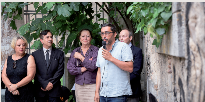
La présentation de l'œuvre réalisée par l'artiste audois VanBinh et des collégien-ne-s à Montoliou.