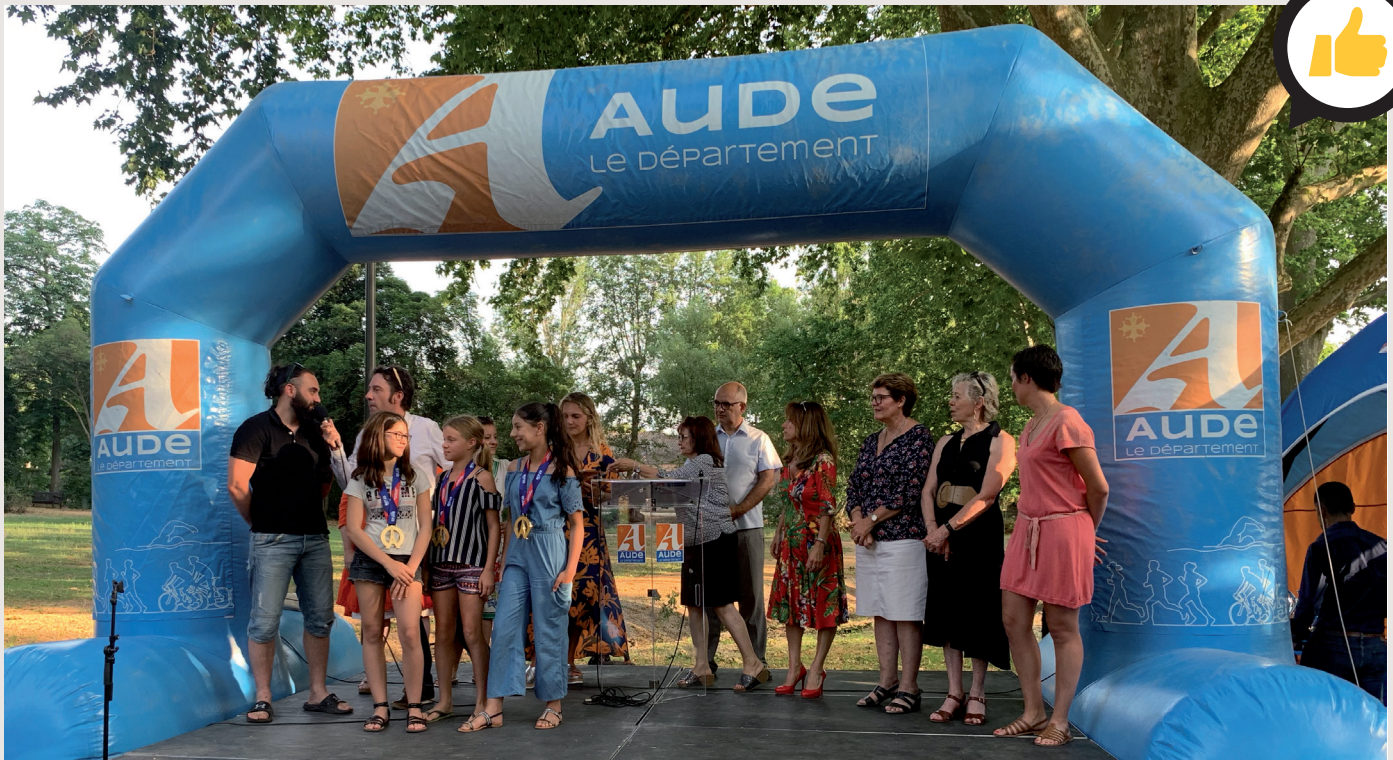
À Villegly, en juillet 2019, les Trophées des champions ont récompensé les sportifs audois qui ont marqué l'année.